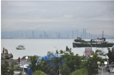
Popołudnie nad Kanałem Panamskim