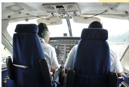
Start do lotu Cessną nad Panama City

Ludzie czasem robią po kilka biznesów w jednym czasie. Trochę Tego, Trochę Tego. Sposobem T.T.T.T., Kodak został wymieciony z rynku aparatów. Bo najpierw nie zauważyli technologii cyfrowej, a potem chcieli robić aparat trochę cyfrowy a trochę na kliszę.